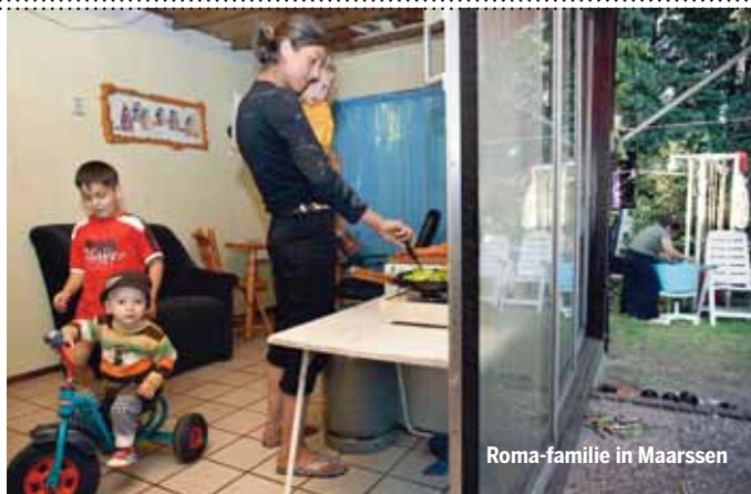
Roma-familie in Maarsse

De ambtenaar die uitvalt op het werk heeft er dus belang bij dat lichamelijke klachten juist niet worden aangemerkt als psychosomatische klachten. Dat maakt het immers veel moeilijker om de drempel van de beroepsziekte te nemen.