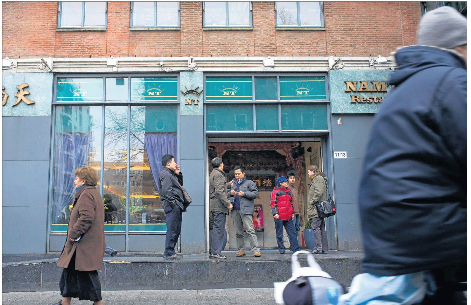
Chinese ondernemers in Amsterdam luiden de noodklok over de berovingen op hun landgenoten. Vooral in Chinese restaurants in de hoofdstad worden de toeristen beroofd. 'Restaurants raken zo hun klanten kwijt, want touroperators willen daar dan niet meer naartoe.'

De proef waarbij met camera's boven de A28 bij Zwolle kentekens worden geregistreerd, wordt uitgebreid naar snelwegen in Drenthe en Groningen. Sinds april worden kentekens bij Zwolle gescand. De beelden worden vergeleken met kentekens van bekende criminelen. De politie is in onderhandeling met Rijkswaterstaat om onder meer ten zuiden van Groningen ook camera's boven de A28 te plaatsen. Details daarover wil de recherche niet kwijt.